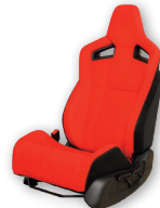
ホンダ CIVIC TYPE R