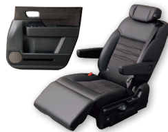
ホンダ STEP WGN