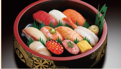
2,500円で購入可能な「銀のさら」の商品例