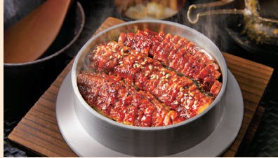
2,500円で購入可能な「釜寅」の商品例

※日本国内の宅配寿司「銀のさら」・「すし上等!」、宅配御膳「釜寅」、レストランの宅配代行「ファインダイン」店舗にて利用可 (一部の店舗ではご利用いただけない場合がございます) ※優待券と引き換えに新潟県魚沼産コシヒカリ(新米) 2kgと交換可 ※お住まいの地域により、メニューや価格が異なります (宅配の地域はホームページを参照してください)