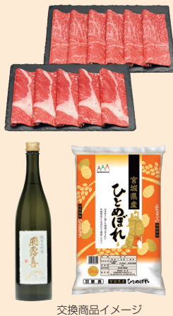
交換商品イメージ

※グルメ、家電製品、体験ギフトなどと交換可 ※翌年3月末日の株主名簿に同一株主番号で連続2回以上記載、かつ100株以上継続保有の場合のみ繰越可（最大1回まで） ※1年以上継続保有（3月末日に100株以上継続保有、かつ株主名簿に同一株主番号で連続2回以上記載）の株主は下記のとおり ・1年以上 ・3年以上 ・5年以上 1,100ポイント（100株以上） 1,200ポイント（100株以上） 1,300ポイント（100株以上） 1,600ポイント（200株以上） 1,700ポイント（200株以上） 1,800ポイント（200株以上） 2,100ポイント（300株以上） 2,200ポイント（300株以上） 2,300ポイント（300株以上） 4,200ポイント（400株以上） 4,400ポイント（400株以上） 4,600ポイント（400株以上） 7,400ポイント（600株以上） 7,700ポイント（600株以上） 8,100ポイント（600株以上） 10,500ポイント（800株以上） 11,000ポイント（800株以上） 11,500ポイント（800株以上）