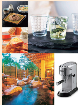
交換商品イメージ

20,000ポイント (2,000株以上) 32,000ポイント (3,000株以上) 44,000ポイント (4,000株以上) 60,000ポイント (5,000株以上)