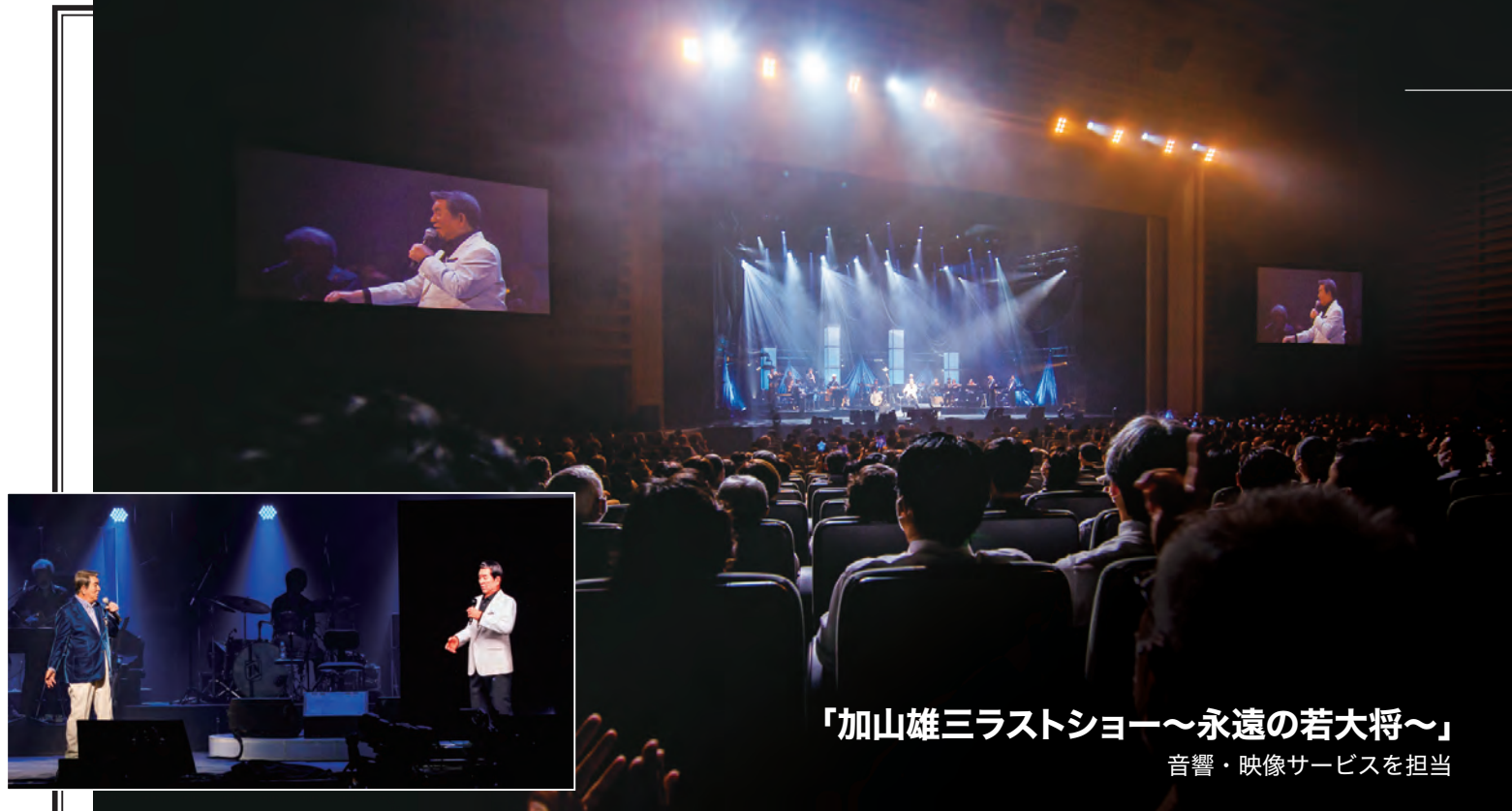
「加山雄三ラストショー～永遠の若大将～」 音響・映像サービスを担当