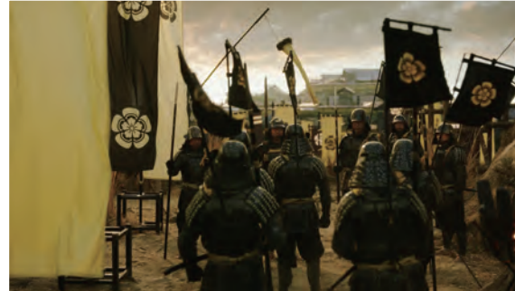
(上) Hibino VFX Studioで撮影：国内初の全編バーチャルプロダクション制作ドラマ・テレビ東京「ひとひらの初恋」 (下) 外部スタジオにバーチャルプロダクションシステムを設置・撮影：NHKの大河ドラマ「どうする家康」